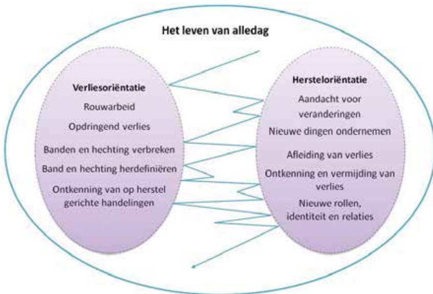
Figuur 2. Duaal Proces Model (Stroebe & Schut, 1999)

Als het nieuwe dermate bedreigend en onveilig is, dat men geneigd is zich vast te klampen aan het oude (een eenzijdige oriëntatie op het verlies), kan het ertoe leiden dat het individu een vesting van eigen waarden, normen en opvattingen om zich heen gaat bouwen. Er ontstaat dan een negatieve houding ten aanzien van het